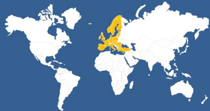
Erasmus+ Partner Countries